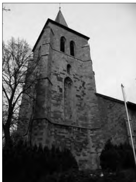
Abb. 13: Stiftskirche von Obermarsberg.

Heft 2, 23; ders., Doppelter Gregor – fiktiver Benedikt, in: Vorzeit Frühzeit Gegenwart 6. Jahrgang 1994 Heft 2, 21; ders., Phantomzeit - Dunkelheit oder Leere im frühen Mittelalter, Zeitsprünge 1/2009