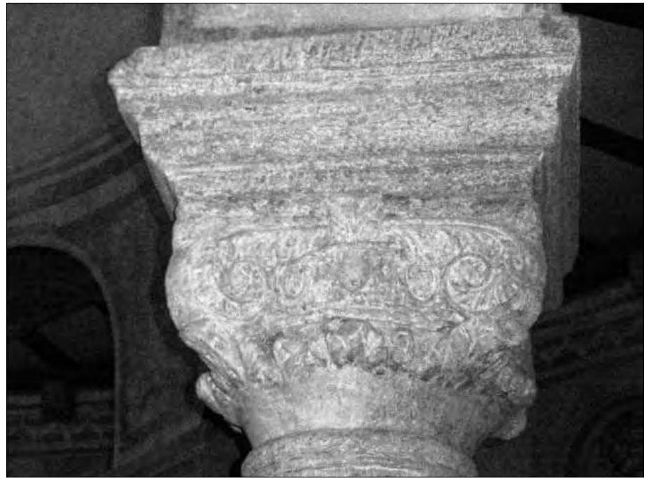
Abb. 4: St. Michaels-Kapelle, Fulda.