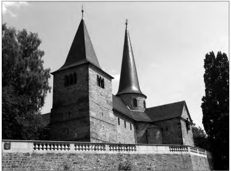
Abb. 8: St. Michael zu Fulda.

Daran, dass die Benediktiner ein ganzes Zeitalter lang der „ geistliche Schwertarm “ der westfränkischen Zerstörer des freien Germaniens waren, scheint mir kaum Zweifel möglich. In unserer heutigen Terminologie waren die missionierenden Benediktiner geistige Terroristen . Diese Bezeichnung mag für alle Missionare zutreffen. Aber die Benediktiner waren – wie die zeitgleichen Missionare des Islam und ihre Bruderschaften – besonders aggressiv und gefährlich. Sie hatten als Waffenbrüder im Glauben die erfolgreichste europäische Militärmacht des frühen Mittelalters, die Westfranken. Die Frage bleibt aber erst noch zu klären, wer wen manipuliert hat: die machtbesessenen fränkischen Herrscher die benediktinischen Missionare – oder die missionsbeseelten und zugleich habgierigen christlichen Drahtzieher mit den Ordensregeln des Heiligen Benedikt die Westfranken. Die Erfolgsbilanz der beiden Verbündeten war jedenfalls beeindruckend. Die westgermanischen Stämme wurden von Süden nach Norden aufgerollt, ihrer Freiheit beraubt. (Abbildung 6). Der Varuskatastrophe an den Externsteinen folgte am Ende die Externsteinkatastrophe . Nach herkömmlicher Zeitrechnung im Jahre 772.