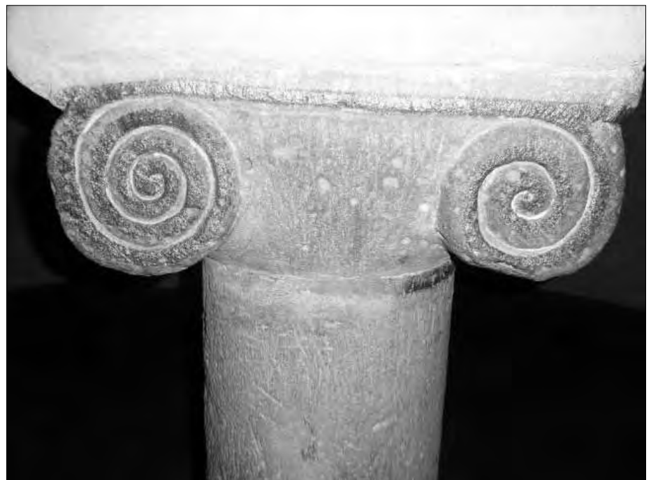
Abb. 5: St. Michaels-Kapelle, Fulda.