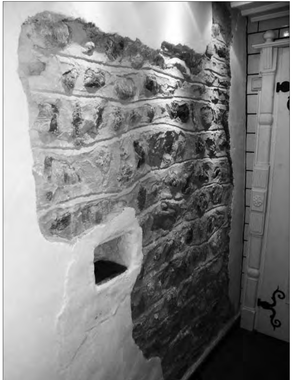
Abb. 7: Karolingische Seitenwand in St. Michaeli

Lehrreich ist die Gründungsgeschichte des Benediktinerklosters in St. Gallen . Die Überlieferung will Glauben machen, die spätere Anlage in der Nordschweiz sei aus einer Einsiedlerklausur des Heiligen Gallus erwachsen (612). Richtig könnte sein, dass die spätere Fürstabtei St. Gallen von Bischof Otmar vom Graubündener Chur aus im Jahre 719 ins Leben gerufen wurde und zunächst alemannische Interessen verfolgte. Nach der Bluttat von Cannstatt im Jahre 746, dem praktisch der gesamte alemannische Adel zum Opfer fiel, habe der Frankenkönig Pippin der Kurze (751 – 768) auf die Übernahme der Benediktiner Mönchsregeln von Montecassino bestanden. Falls diese Personen nicht Füllsel der Phantomzeit sind. Dieser Entstehungsverlauf der benediktinischen Klöster scheint mir beispielhaft zu sein: Klöster als spontane dezentrale Gründungen einer christlichen Zelle aus den verschiedensten Anlässen, meistens von iroschottischen Missionaren ausgehend (auf die schon Herman Wirth und Heribert Illig hereingefallen sind), werden aufgrund fränkischen Einflusses gleichgeschal-