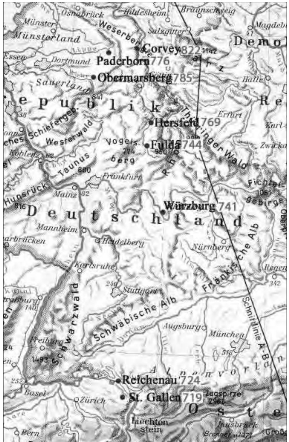
Abb. 1: Expansion der Benediktiner.

Wir stellen diese Frage vor einem historischen Hintergrund, der weitgehend ungewiss, unklar konturiert ist. Für die Leser mit einer vor 35 Jahren herkömmlichen höheren Schulbildung und mit intaktem Erinnerungsvermögen ist die Sache klar: Der Westfrankenkönig Karl, später „der Große“ genannt, ließ auf dem Reichstag von Worms im Jahre 771 einen Kriegszug gegen die Sachsen beschließen. Nach der Einnahme der Eresburg auf dem Obermarsberg bemächtigte Karl sich im Jahre 772 der