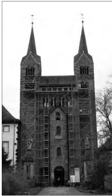
Abb. 12: Stiftskirche von Corvey.