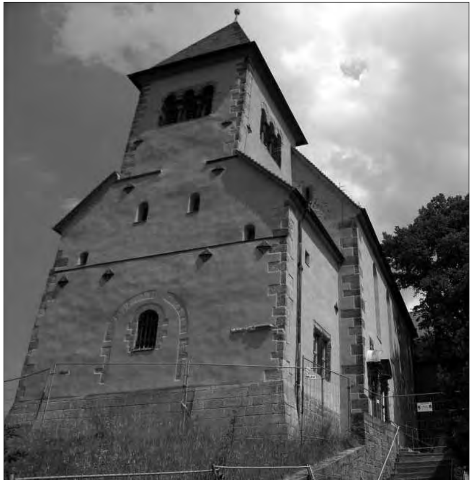
Abb. 10: St. Lioba auf dem Hugesberg.

Das Benediktinerkloster in Corvey muss nach seiner Gründung den Bischofssitz Paderborn an Bedeutung weit übertroffen haben. Ludwig der