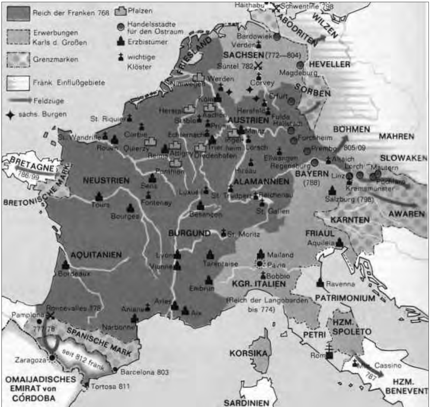
Abb. 6: Expansion der Westfranken.