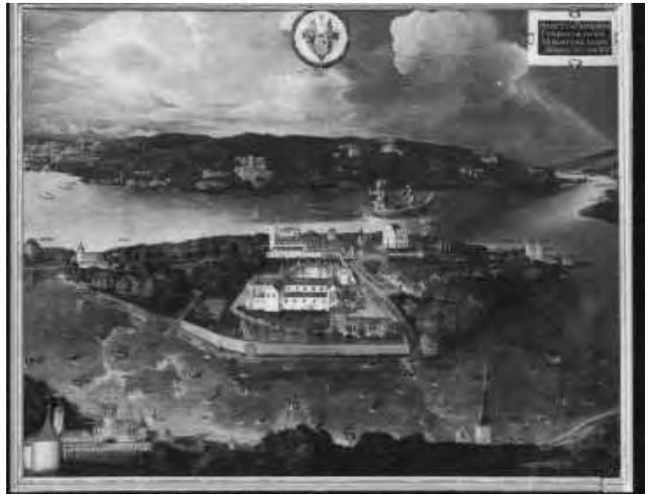
Abb. 9: Reichenau.

Von Fulda aus wurde kirchlicher Überlieferung nach Hrabanus zum Erzbischof von Mainz berufen. Von zwei der drei deutschen Städte, die lange Zeit Sitz der antiken römischen