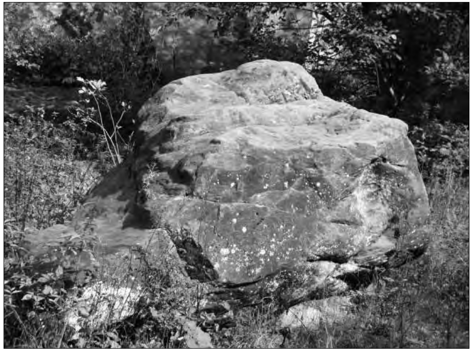
Abb. 2: Zerstörte Externsteine (Fragment).