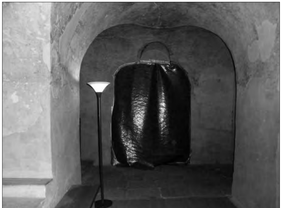
Abb. 3: Krypta St. Lioba in Fulda, alter Eingang von Norden.