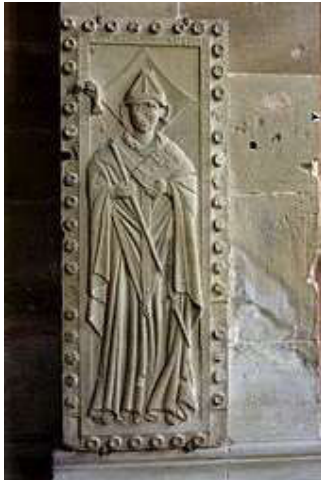
Grabplatte des Bischofs im Kloster Maulbronn

Ulrich von Dürrmenz (auch Ulrich I. von Speyer ) († 26. Dezember 1163 in Maulbronn , beigesetzt im Kloster Maulbronn) war Reichskanzler unter Kaiser Friedrich I. und erwählter Bischof von Speyer .