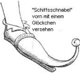
"Schiffsschnabel" vorn mit einem Glöckchen versehen

ab dem 15. Jahrhundert besondere Unterschuhe oder Trippen, die aus Holz mit einem Überzug von Leder, genau nach der Form der Sohle, zur Unterstützung der Schnabel langspitzig gestaltet und zu ihrer Befestigung mit Spanriemen versehen waren