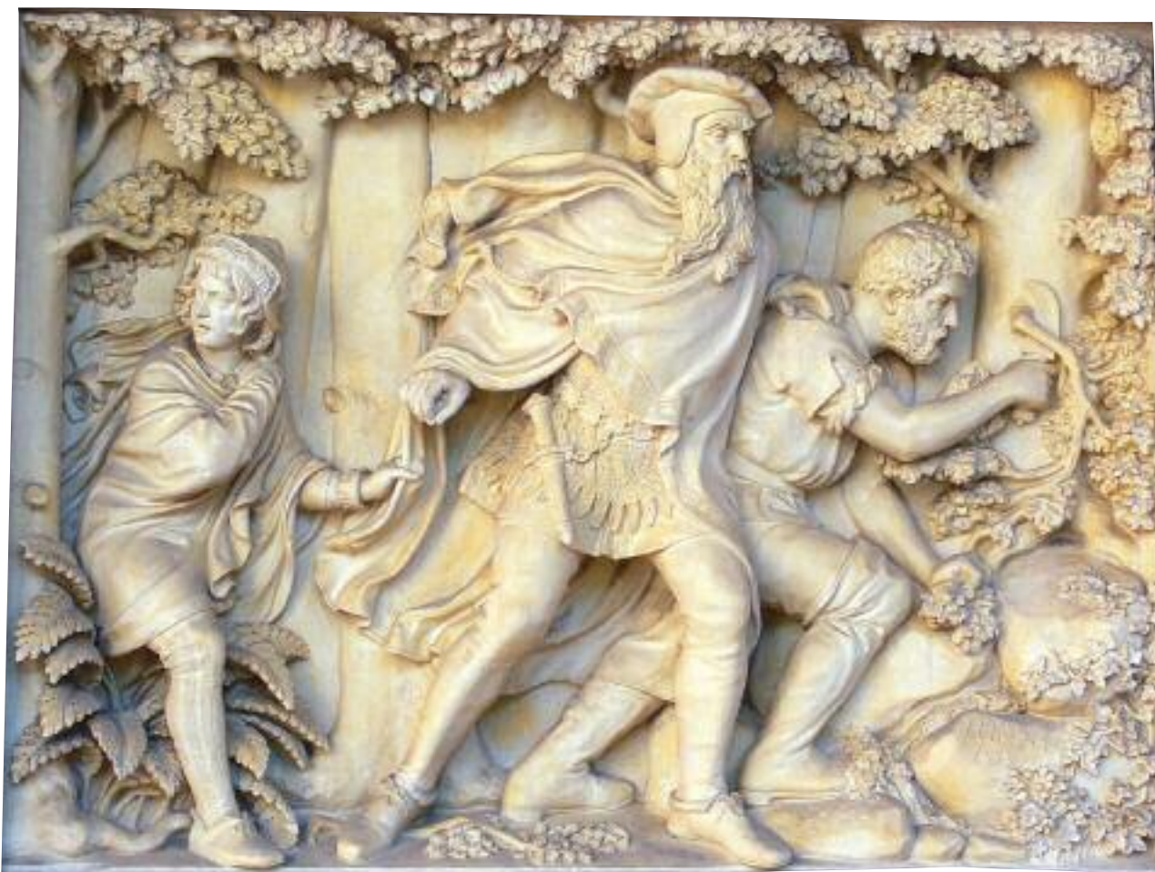
Die dramatische Flucht Graf Eberhards des Greiners in der Sicht des 19. Jahrhunderts. Terrakotta-Relief an der Nordseite des Palais Thermal in Wildbad, einst Eberhardsbad, 1859, Hermann Rudolf Heidel (1811–1865).