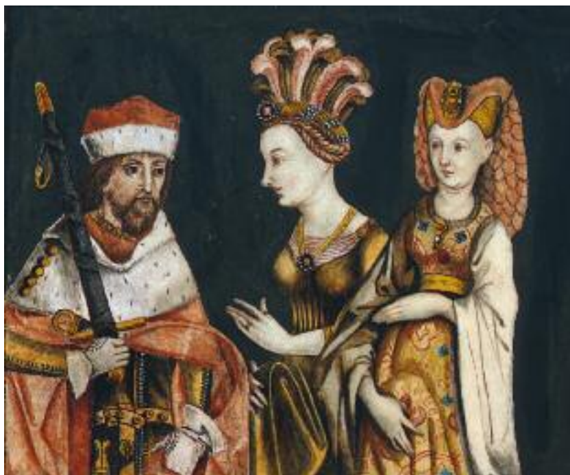
Ruprecht I., Herzog von Bayern und Pfalzgraf bei Rhein, der vermutliche Anstifter des Überfalls auf Eberhard den Greiner, mit seinen beiden Frauen: links Elisabeth von Namur, rechts Beatrix von Berg. Ausschnitt aus der sogenannten Amberger Ahnenreihe, Gouache auf Pergament, 18. Jh.