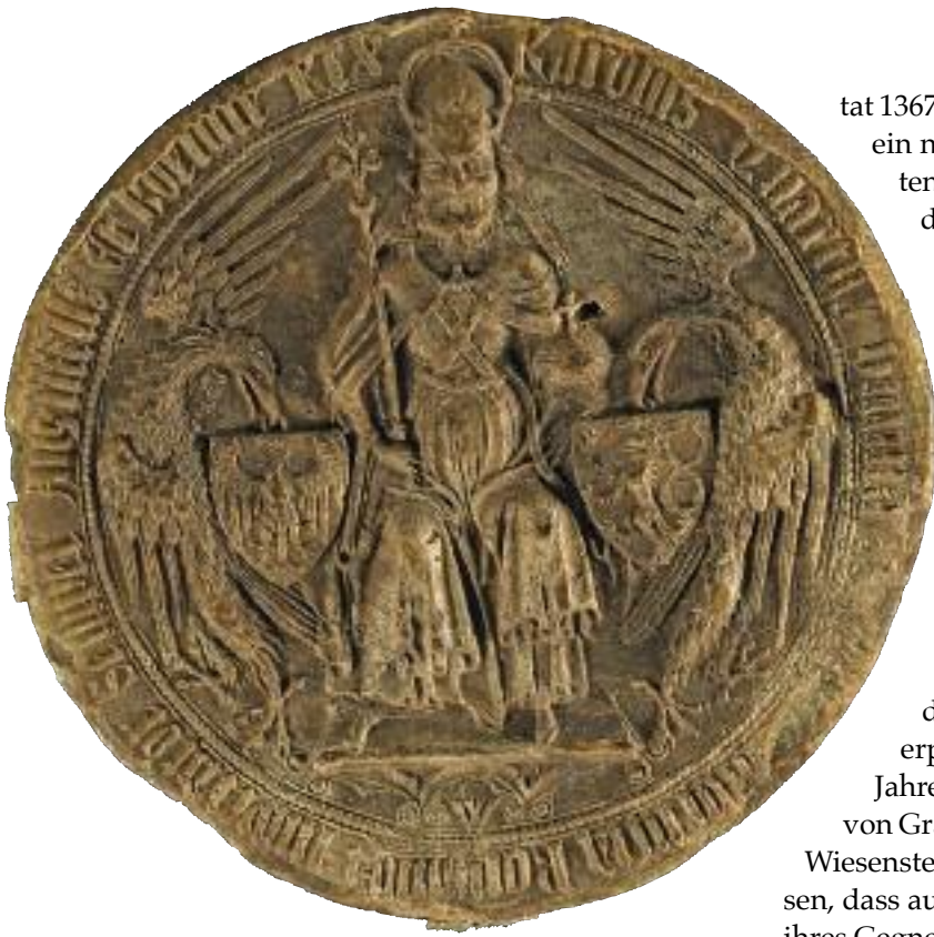
Kaiser Karl IV. im Siegel der Urkunde des Friedensvertrags zwischen Württemberg und Baden vom 17. September 1370.

lichkeiten entlud. 23 Wolf von Eberstein und dessen am Attentat nicht beteiligter Oheim Wilhelm, das Haupt des Hauses Eberstein, wurden zwar kurzfristig durch den Landfriedensrichter Graf Ludwig X. von Oettingen (gest. 1370) vorgeladen, erschienen aber nicht. Nachdem in der Verhandlung Graf Eberhard mit drei Zeugen die Tatsache des Überfalls beschworen hatte, wurde gegen die Grafen von Eberstein die Reichsacht verhängt und ihre Güter wurden als dem Reich heimgefallen erklärt. 24