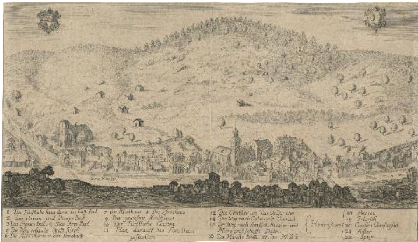
Wildbad um 1667. Ansicht aus halber Höhe von Westen. Kupferstich, Lorenz Braun zugewiesen.

Bedürfnissen des württembergischen Hofstaats, im kalten (oder künstlich erwärmten) Wasser zu baden, wenn in der Nähe, allerdings sehr nahe westlich an feindlich gesinnte Adelsherrschaften grenzend, ein heimisches Heilbad mit aus Granitspalten hervortretendem Wasser von 35-41 Grad zur Verfügung stand. 19 Mit einer Reitergruppe einen nächtlichen Überraschungsangriff direkt von der mehr als 50 Kilometer entfernten Stammburg Neueberstein oder von der nahen Amtsstadt Gernsbach aus so tief in württembergisches Territorium hinein bis zum heutigen Bad Teinach – auf beschwerlich zu nutzen den Wegen über die Bergrücken beiderseits der Großen Enz – durchzuführen, überforderte zudem in dieser Zeit die strategischen Fähigkeiten der Verschwörer gegenüber einem militärisch überlegenen Gegner.