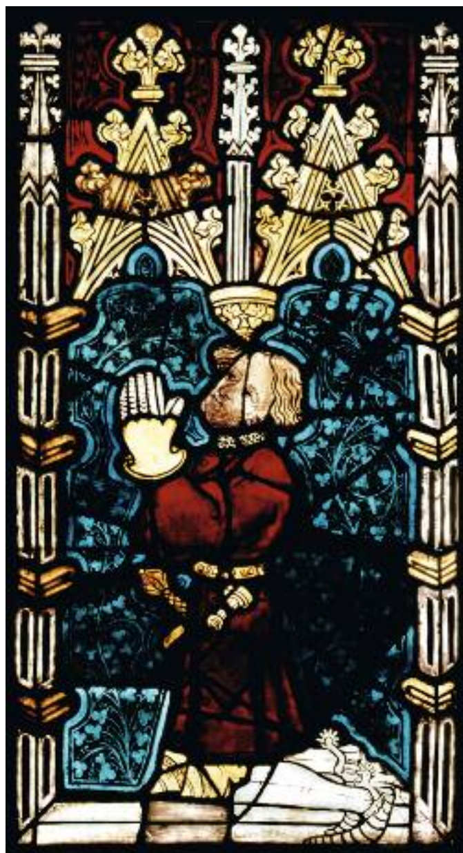
Graf Eberhard II. von Württemberg und Markgraf Rudolf VI. von Baden in den Chorfenstern der Kirche St. Maria Magdalena in Tiefenbronn, Enzkreis, um 1390 (77,5x35,5 u. 76,5–41,5 cm). Offensichtlich sühnten die Grafen ihre gegenseitigen Gewalttaten (und indirekt auch die der badischen Vasallen beim Attentat in Wildbad?) mit einer Gemeinschaftsstiftung für die Kirche in Tiefenbronn, wobei sie sich in den Stifternischen im frommen Werk vereint zeigen. Die Identifizierung der Fürsten ergibt sich aus deren Helmzier und der Datierung der Fensterstiftung, bei Eberhard II., bei dem es sich um die älteste erhaltene Darstellung eines württembergischen Grafen handelt, zudem aus dem ursprünglich angebrachten Wappen.