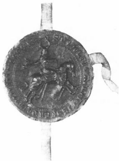
Umschrift des Siegels: + S · RVDOLFI · MARCHIONIS · DE · BADEN · FILII · D[IC]TI · WEGGER

Die Bilder auf den Siegeln zeigen jeweils die Fürsten als kämpfende Ritter zu Pferd. Wichtig sind die relativ kleinen Wappenschilde, für Baden der geteilte Schild, für Wirttemberg die drei Hirschstangen.