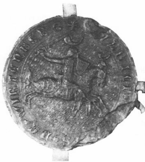
Umschrift des Siegels: + [V]LRICI * [COMITI]S * DE * WIRTEMBERG