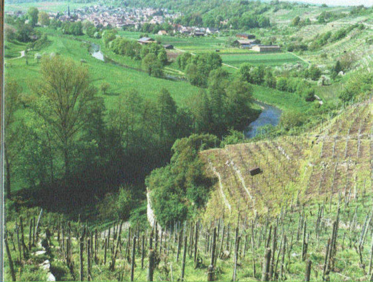
Enzschleife in Mühlhausen. Jüngstes von vier Naturschutzgebieten.