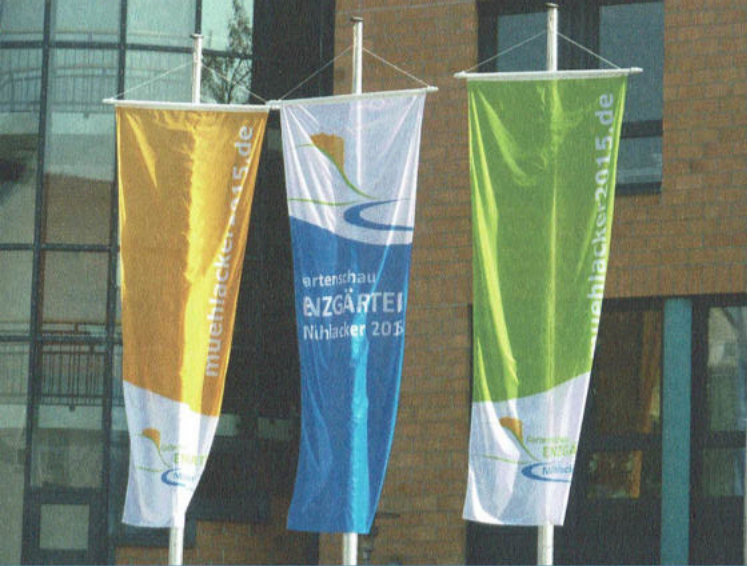
Das Rathaus in Mühlacker