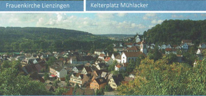
Blick auf Enzberg