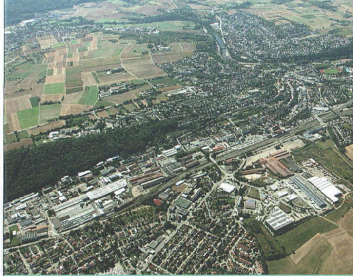
Zentral gelegener, starker Wirtschaftsstandort

Mühlacker ist die einzige Große Kreisstadt im Enzkreis und mit rund 25.000 Einwohnern eine junge und dynamische Stadt – ihre Geschichte aber ist uralte. Bereits vor 12.000 Jahren ließen sich hier Menschen nieder, wie archäologische Funde zeigen. Begünstigt durch die strategisch gute Lage an der Schnittstelle wichtiger Handels- und Heerstraßen, blühte Mühlacker später rasch auf und wuchs im 19. Jahrhundert zum Bahnknotenpunkt und industriellen Zentrum der Region heran. Weitere Wachstumsschübe erhielt die Stadt in den ersten zwanzig Jahren des 20. Jahrhunderts, in denen sich ganze 106 gewerbliche Unternehmen ansiedelten. Und nochmals nach dem Ende des Zweiten Weltkriegs, als die Arbeitsplatz- und Einwohnerzahl enorm anstieg.