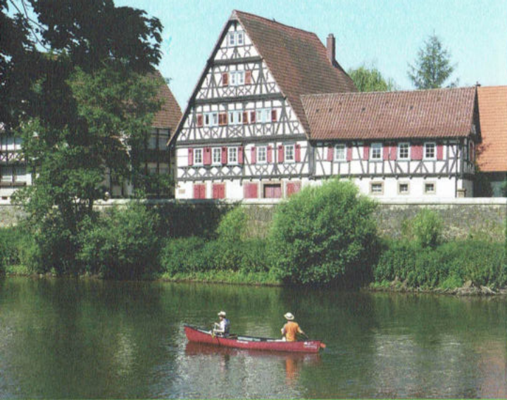
Kanufahrt entlang dem Kernerhaus in Dürrmenz